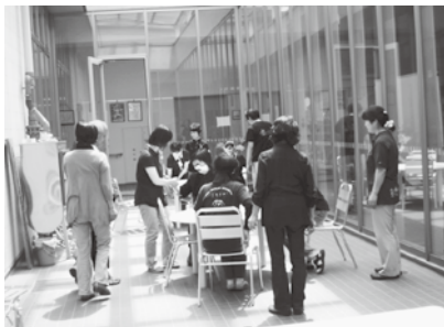
<6月28日移動介助実習の様子>