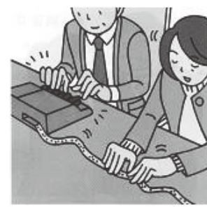
<プリスタによる通訳方法>